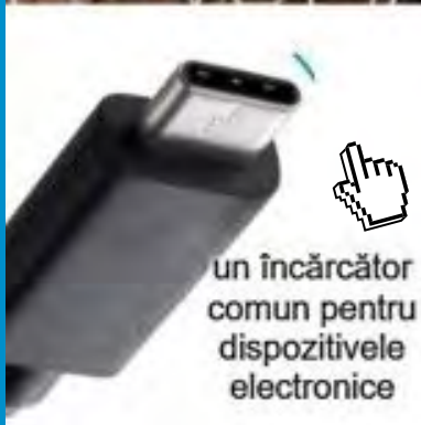
un încărcător comun pentru dispozitivele electronice

Executivul UE a prezentat propunerea de directivă revizuită privind dispozitivele electronice portabile. Propunerea Comisiei Europene reprezintă un pas important împotriva deșeurilor electronice și a inconvenientelor cauzate consumatorilor de prevalența diferitelor încărcătoare incompatibile pentru dispozitivele electronice.